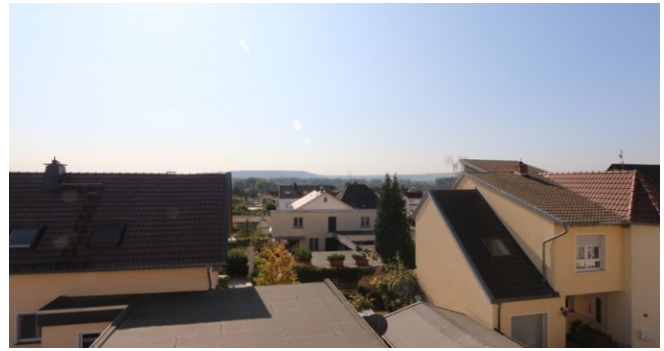
Blick von Loggia