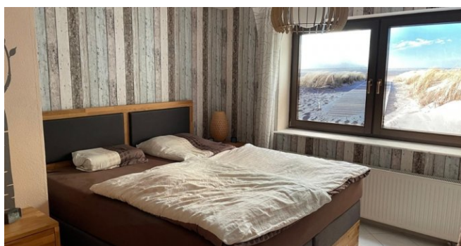
Wohnlicher Raum Keller