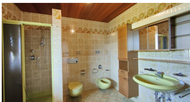
OG: Bad en suite