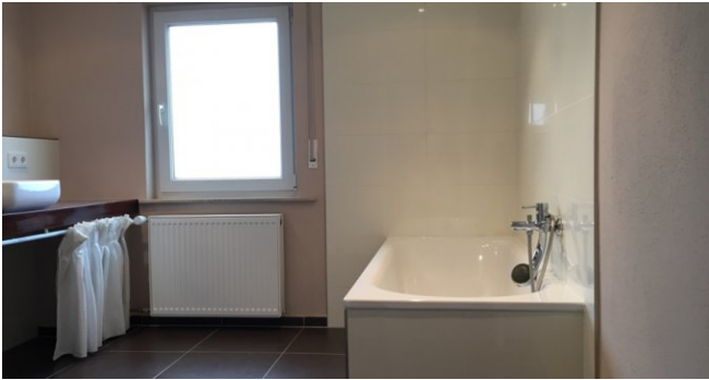
OG BAD 2