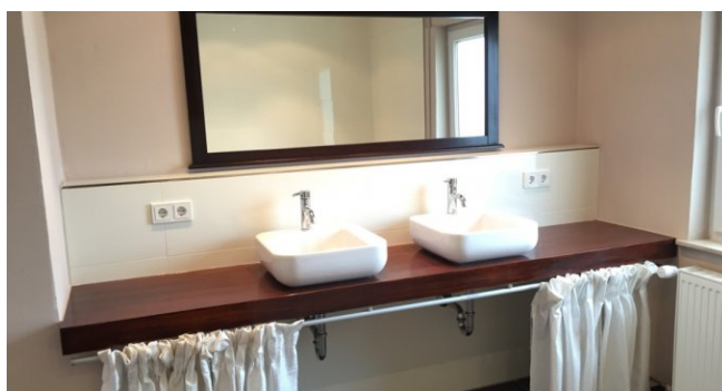
OG BAD 1