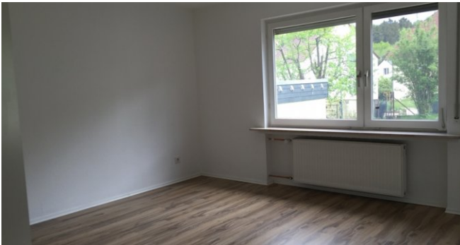
EG Zimmer 1