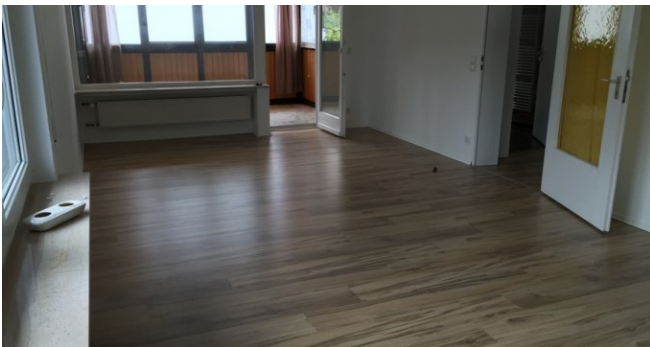
OG Zimmer mit Wintergarten