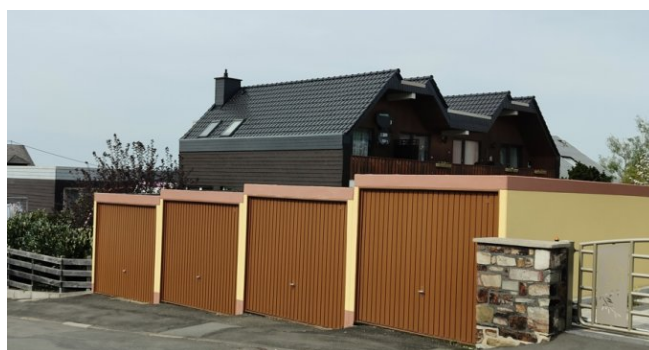
Seitenansicht mit Garagen