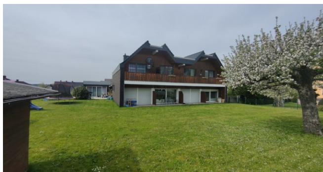
Grundstück mit Haus