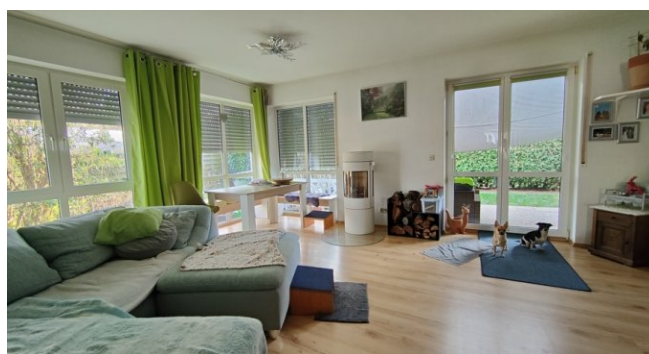
EG Wohnung links