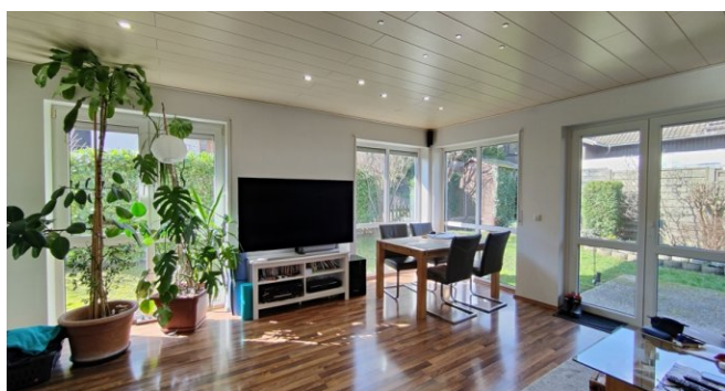
EG Wohnung rechts