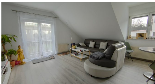
Wohnzimmer DG links