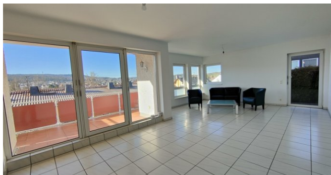
Whg OG: Wohnen