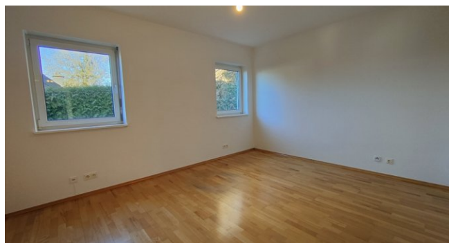
Whg. OG: Zimmer