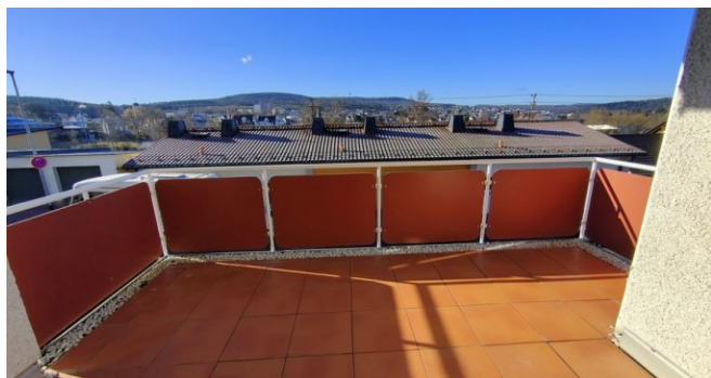
Whg. OG: Balkon