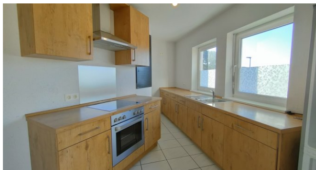
Whg. OG: Küche