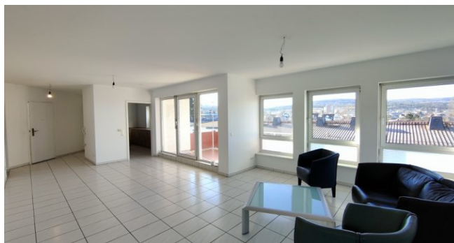
Whg OG: Wohnen