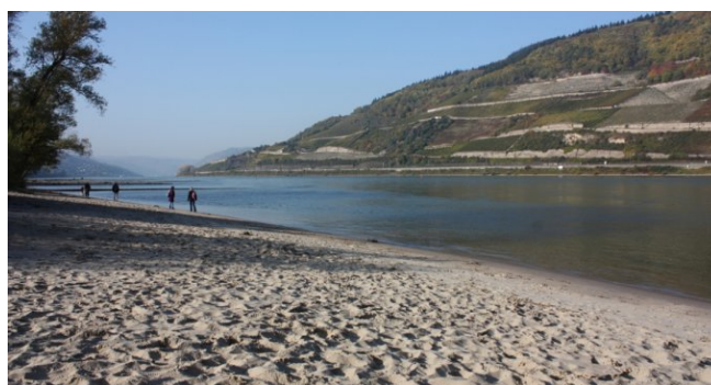
Strand im Ort